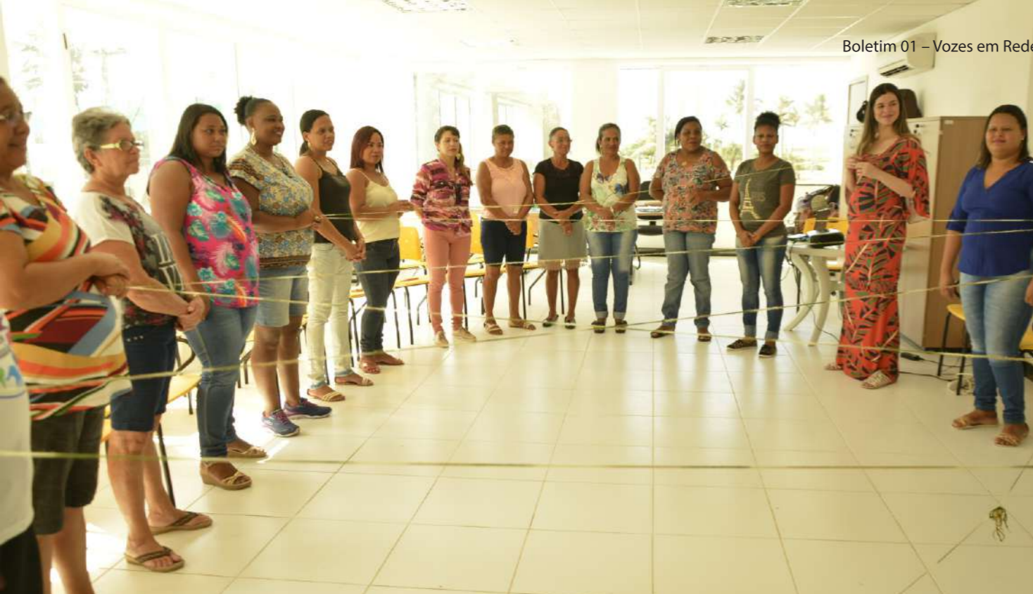
Mulheres de várias comunidades fortalecem a Rede