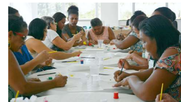
Mulheres desenham a mão livre