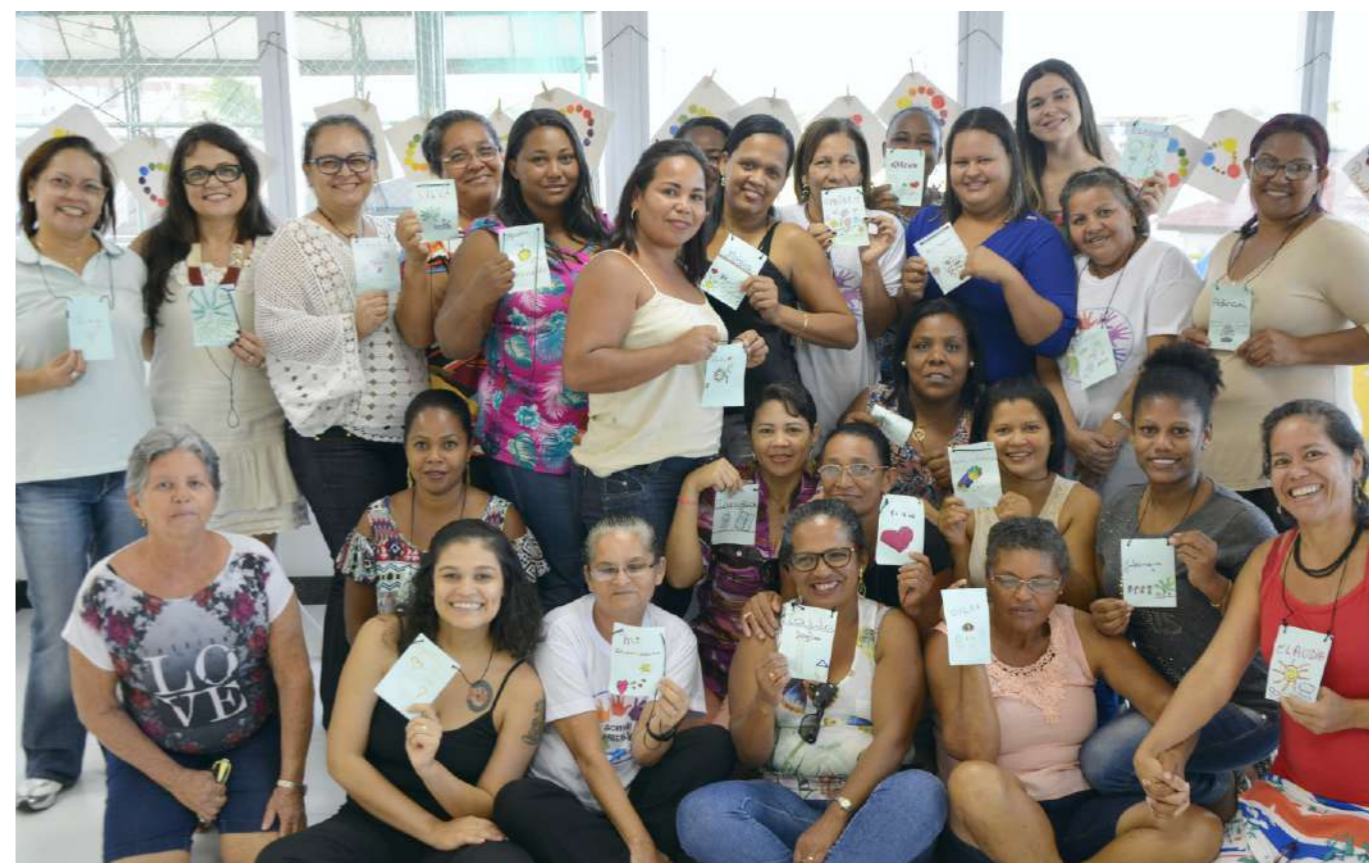
Rede de mulheres dando seus primeiros passos

O projeto Rede Solidária de Mulheres de Sergipe na sua concepção atuará, por meio de processos educativos, para estimular e ampliar as oportunidades de inserção profissional de 400 mulheres em três áreas urbanas e nove povoados, situados nos municípios de Carmópolis, Indiaroba, Estância, Barra dos Coqueiros, Pirambu, Japarutuba, todos localizados em áreas de Mata Atlântica e Restinga no estado de Sergipe.